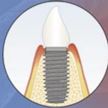
Entzündung am Implantat (Periimplantitis)

Ein durch Bakterien infiziertes und entzündetes Zahnbett bildet sich stetig zurück. Mit der Zeit verlieren die Zähne ihren Halt. Gleiches gilt auch bei Implantaten – also künstlichen Zahnwurzeln – um welche sich der Kieferknochen entzündet. Die Folge: Der natürliche oder der künstliche Zahn geht verloren.